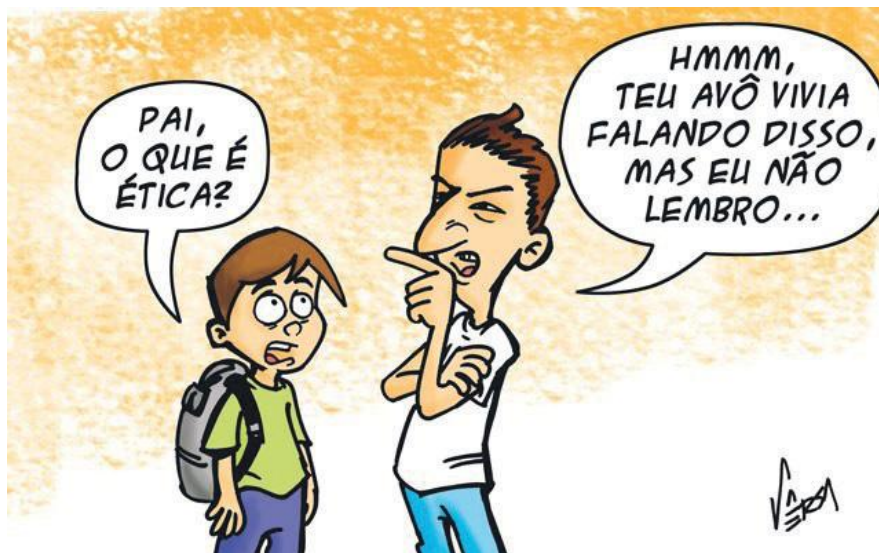
Figura 2. Embora seja algo fundamental a convivência humana, a Ética parece cada vez mais escassa.