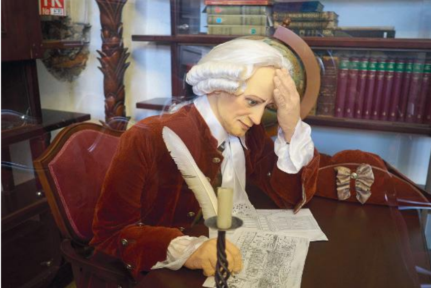
Figura 3. O filósofo Immanuel Kant, foi um dos mais importantes nomes do século XVIII.

Em sua obra 'Fundamentação da Metafísica dos Costumes' ele postulou a Ética como algo que devemos fazer independente da pressão externa que sofremos.